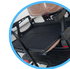
ASIENTOS TRASEROS CONVERTIBLES EN BANDEJA