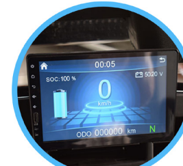
PANTALLA COLOR CON PUERTO USB