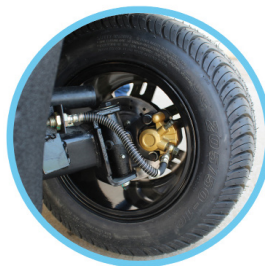
FRENO DE DISCO