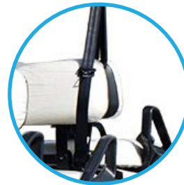
CINTURONES 3 ANCLAJES (versión GC2T)