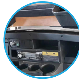
RADIO Y USB