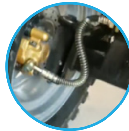
FRENOS DE DISCO DELANTEROS